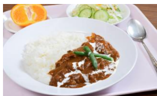
社員食堂の一例(ハヤシライス)