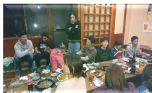
メンター制度の様子(食事会)