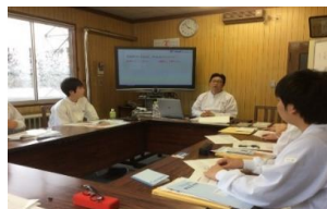
研修の様子(新人研修・ビジネスマナー研修・年次研修等)